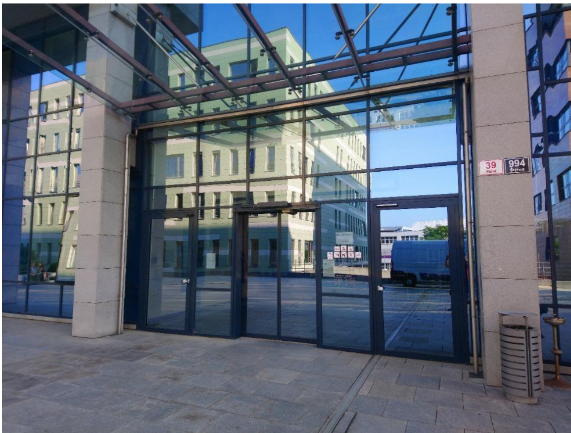
Obr. 1 Hlavní vstup do budovy soudu