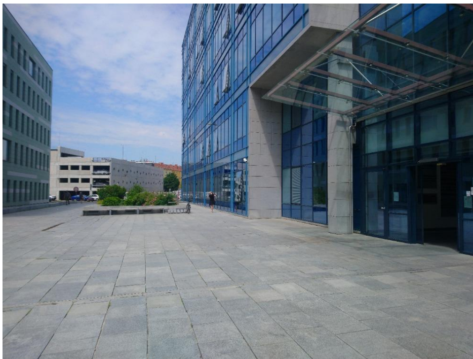
Obr. 9 Příchod k budově soudu od tramvajové zastávky Vojtova, v pozadí parkovací dům Riverpark