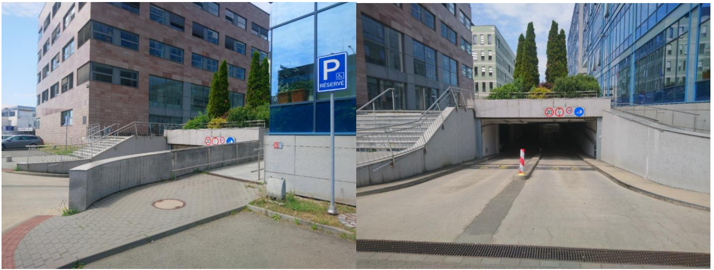
Obr. 8 parkovací místo pro invalidy a příjezd na parkoviště pro návštěvníky JAB