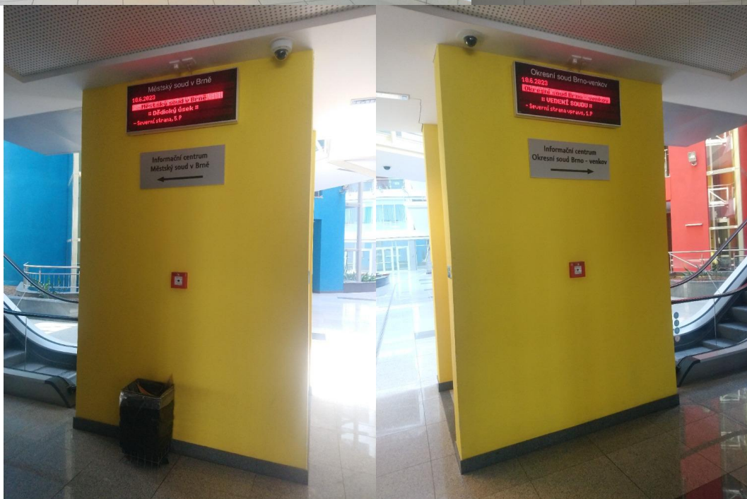
Obr. 3 Orientační tabule u výtahu a na chodbě, elektronický běžící text na hlavním vstupu do budovy