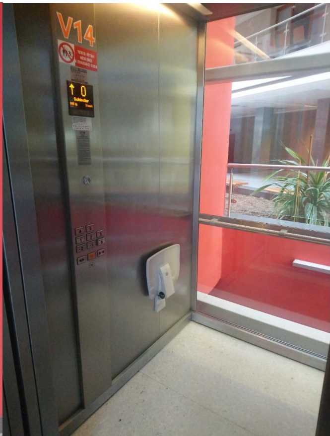
Obr. 7 Vstup do výtahu a kabina výtahu