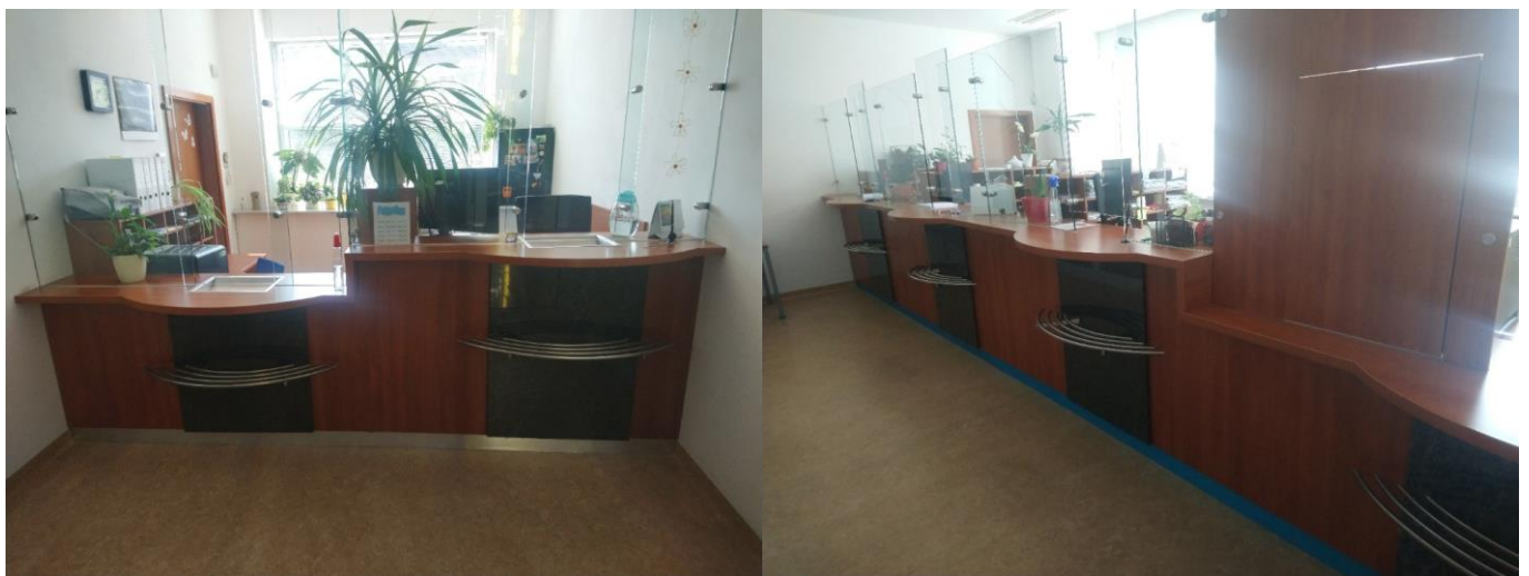
Obr. 4 Pokladna a podatelna soudu