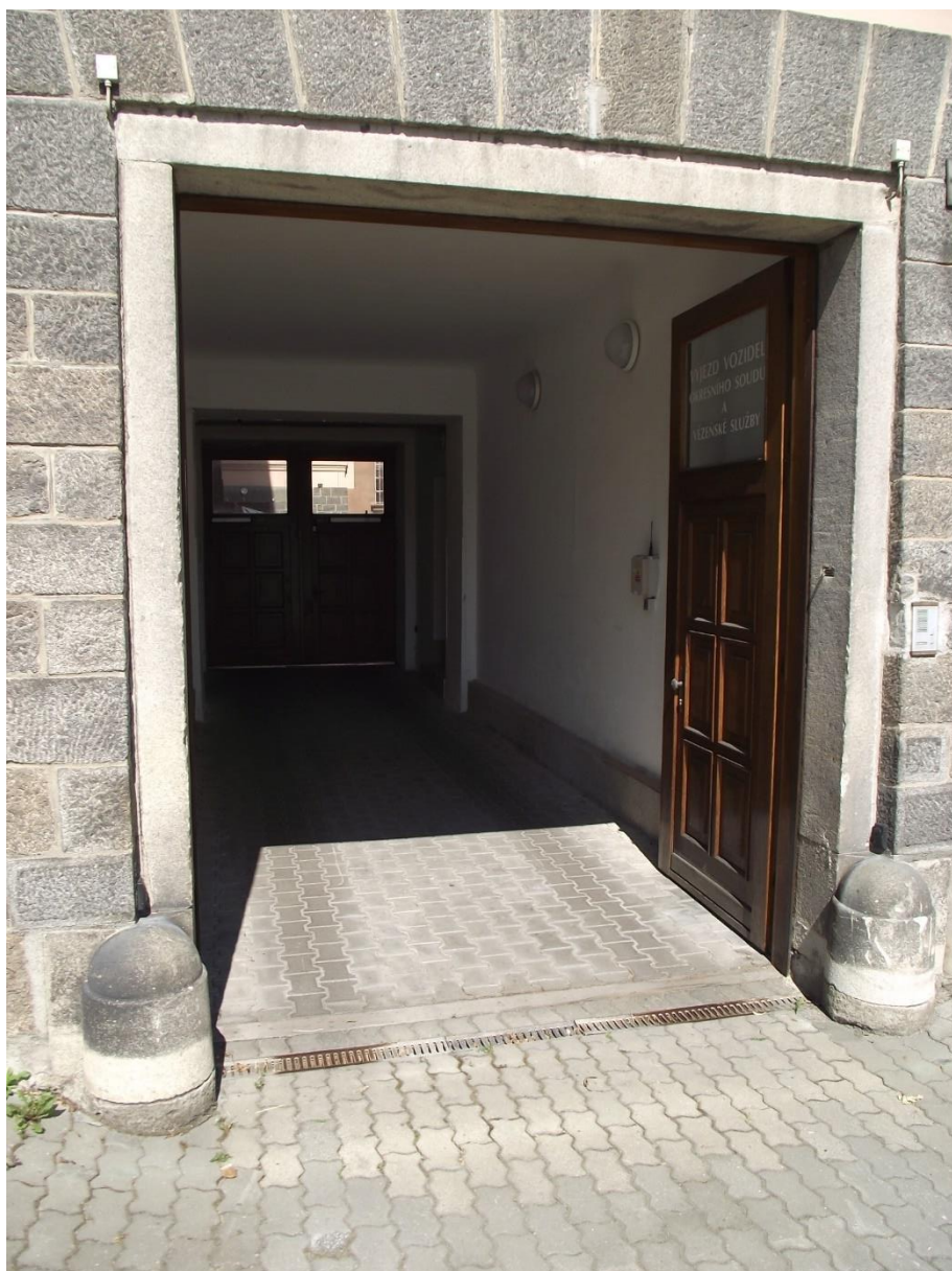
Bezbariérový přístup – vjezd z Purkyňova nám.

Požadavky vyplývají ze stavebního zákona č.183/2006 Sb. a z prováděcích vyhlášek SZ - vyhláška č.398/2009 Sb.