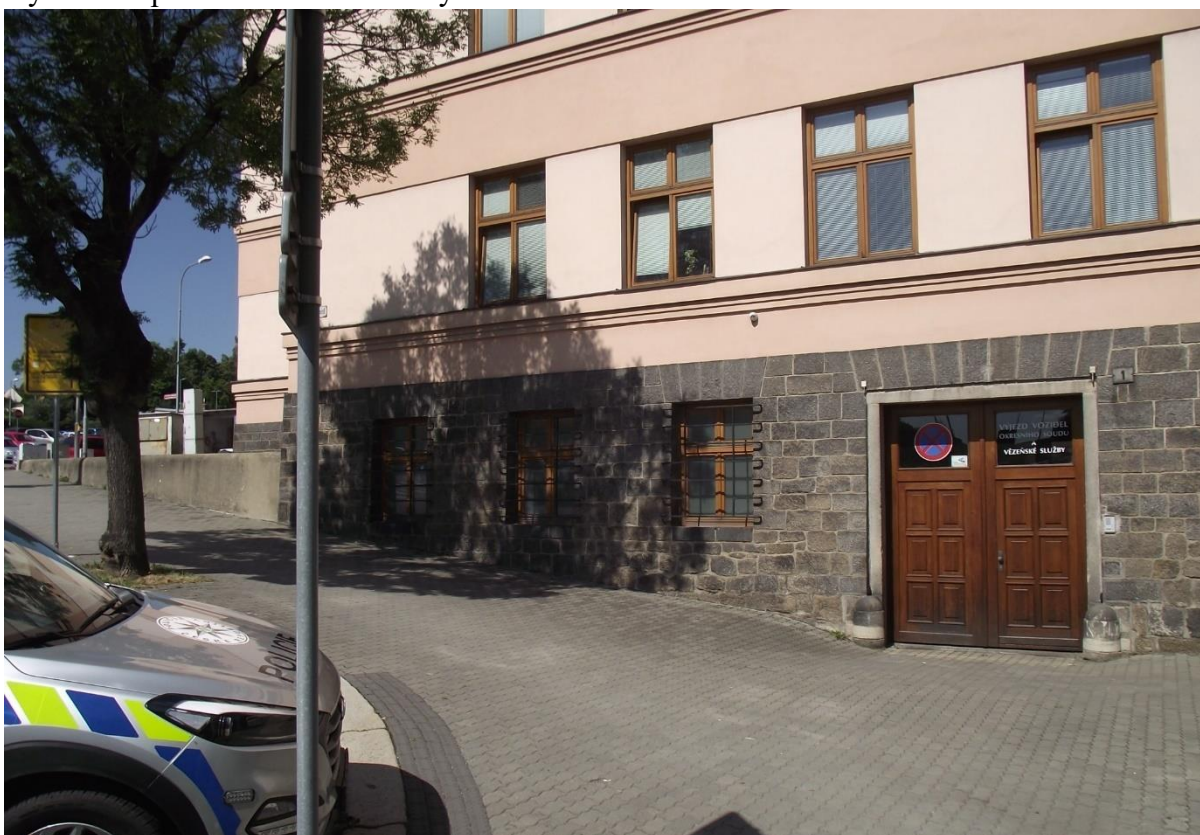
Boční vjezd – bezbariérový přístup z Purkyňova nám.

Požadavky vyplývají ze stavebního zákona č.183/2006 Sb. a z prováděcích vyhlášek SZ - vyhláška č.398/2009 Sb.