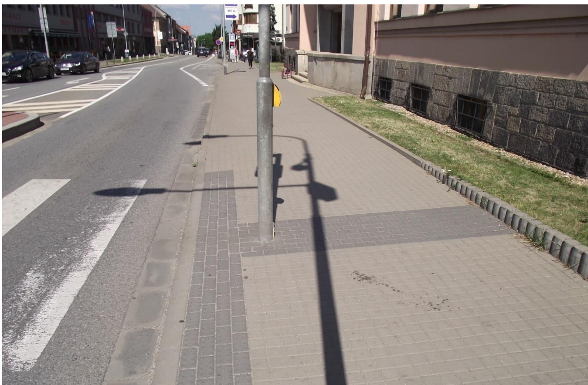
Bezbariérový nájezd na chodník, osazení dlažby pro slabozraké – Bráfova ul.

Požadavky vyplývají ze stavebního zákona č.183/2006 Sb. a z prováděcích vyhlášek SZ - vyhláška č.398/2009 Sb.