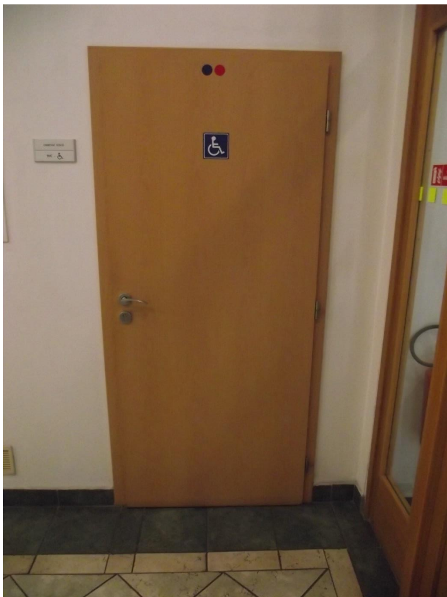
Dveře v 1 NP - bezbariérové WC

Požadavky vyplývají ze stavebního zákona č.183/2006 Sb. a z prováděcích vyhlášek SZ - vyhláška č.398/2009 Sb.