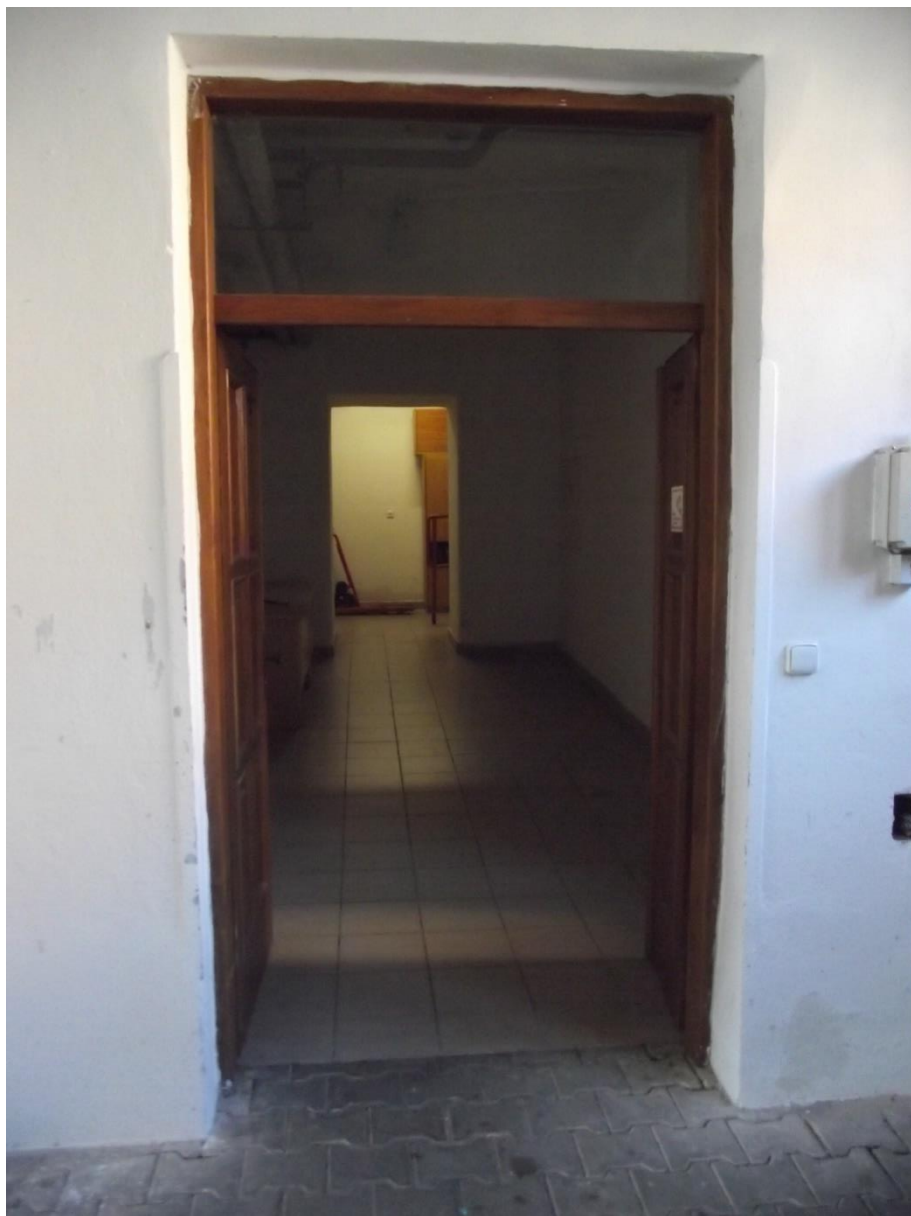
Bezbariérový přístup 1 PP