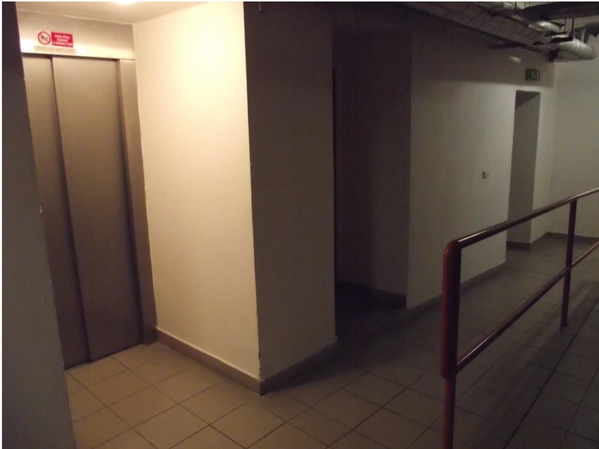
Bezbariérový přístup – 1 PP ke stanici výtahu

Požadavky vyplývají ze stavebního zákona č.183/2006 Sb. a z prováděcích vyhlášek SZ - vyhláška č.398/2009 Sb.