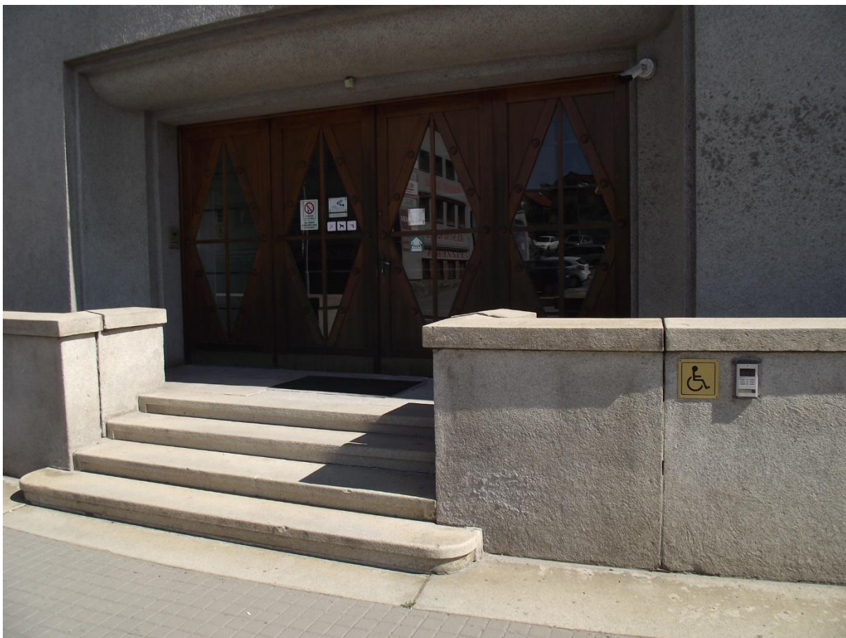
Vstup do budovy soudu – videotelefon s piktogramem pro komunikaci s tělesně hendikepovanými