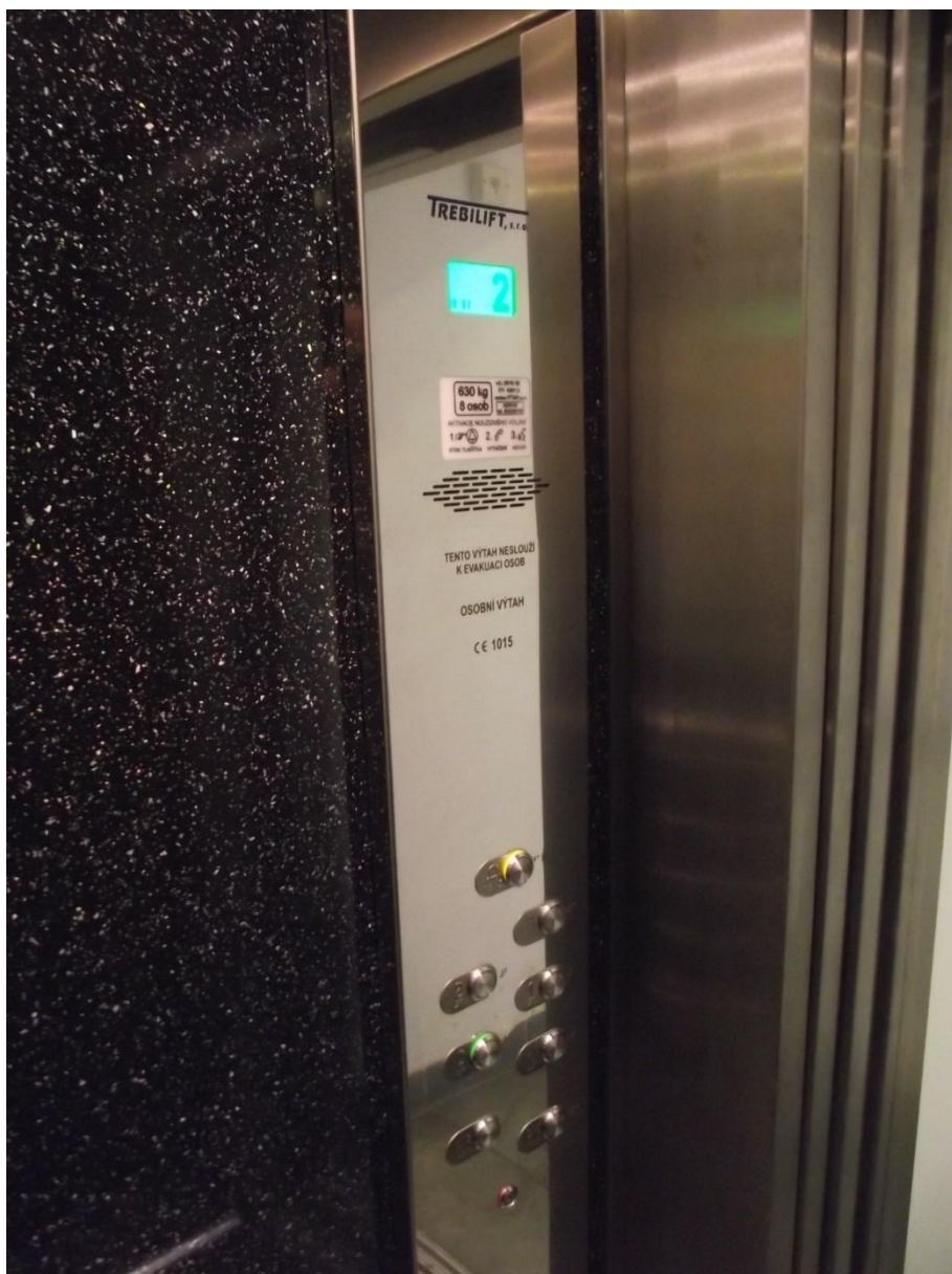
Řídicí panel výtahu

Požadavky vyplývají ze stavebního zákona č.183/2006 Sb. a z prováděcích vyhlášek SZ - vyhláška č.398/2009 Sb.