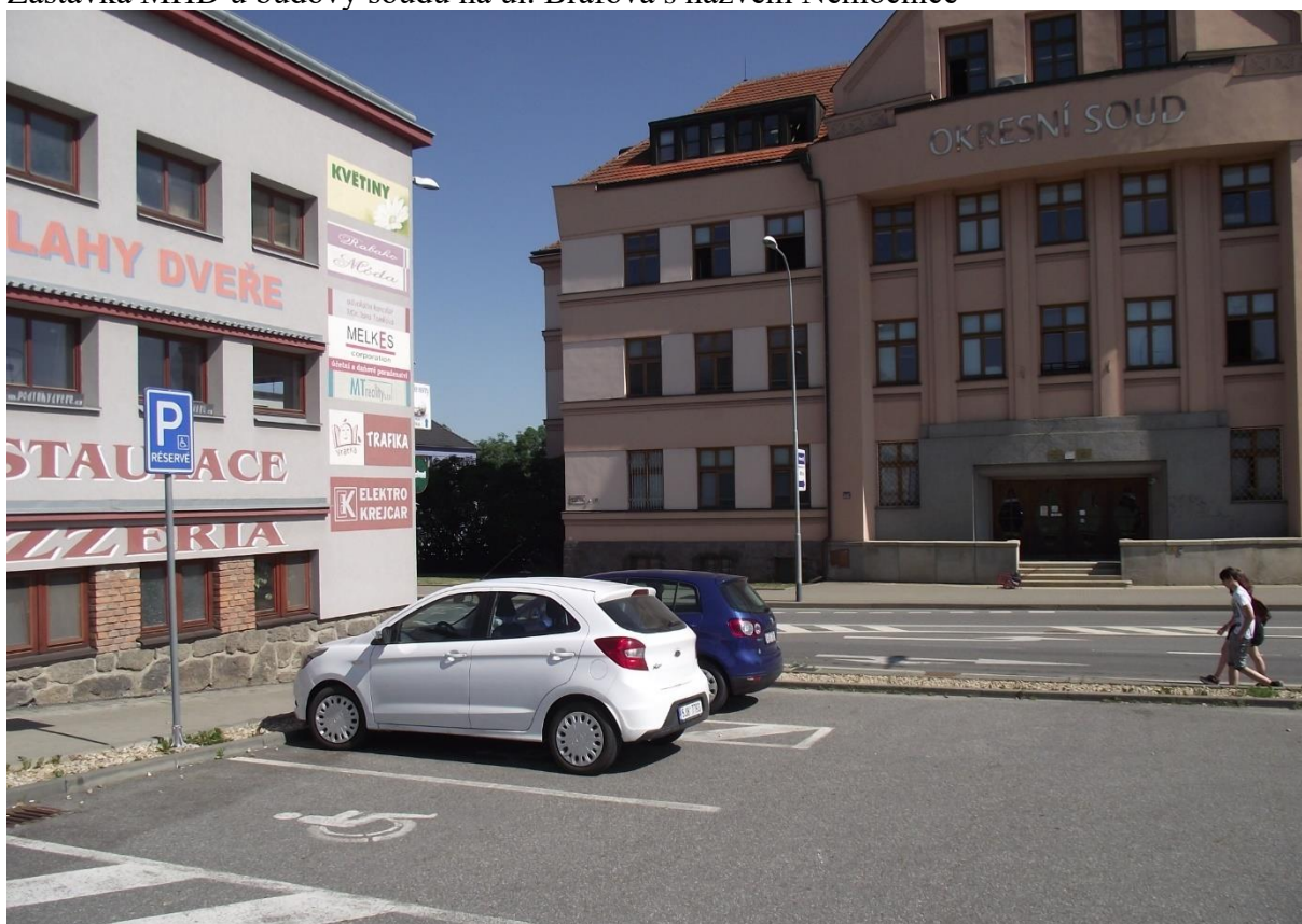
Vyhrazené parkovací stání Bráfova ul.

Požadavky vyplývají ze stavebního zákona č.183/2006 Sb. a z prováděcích vyhlášek SZ - vyhláška č.398/2009 Sb.