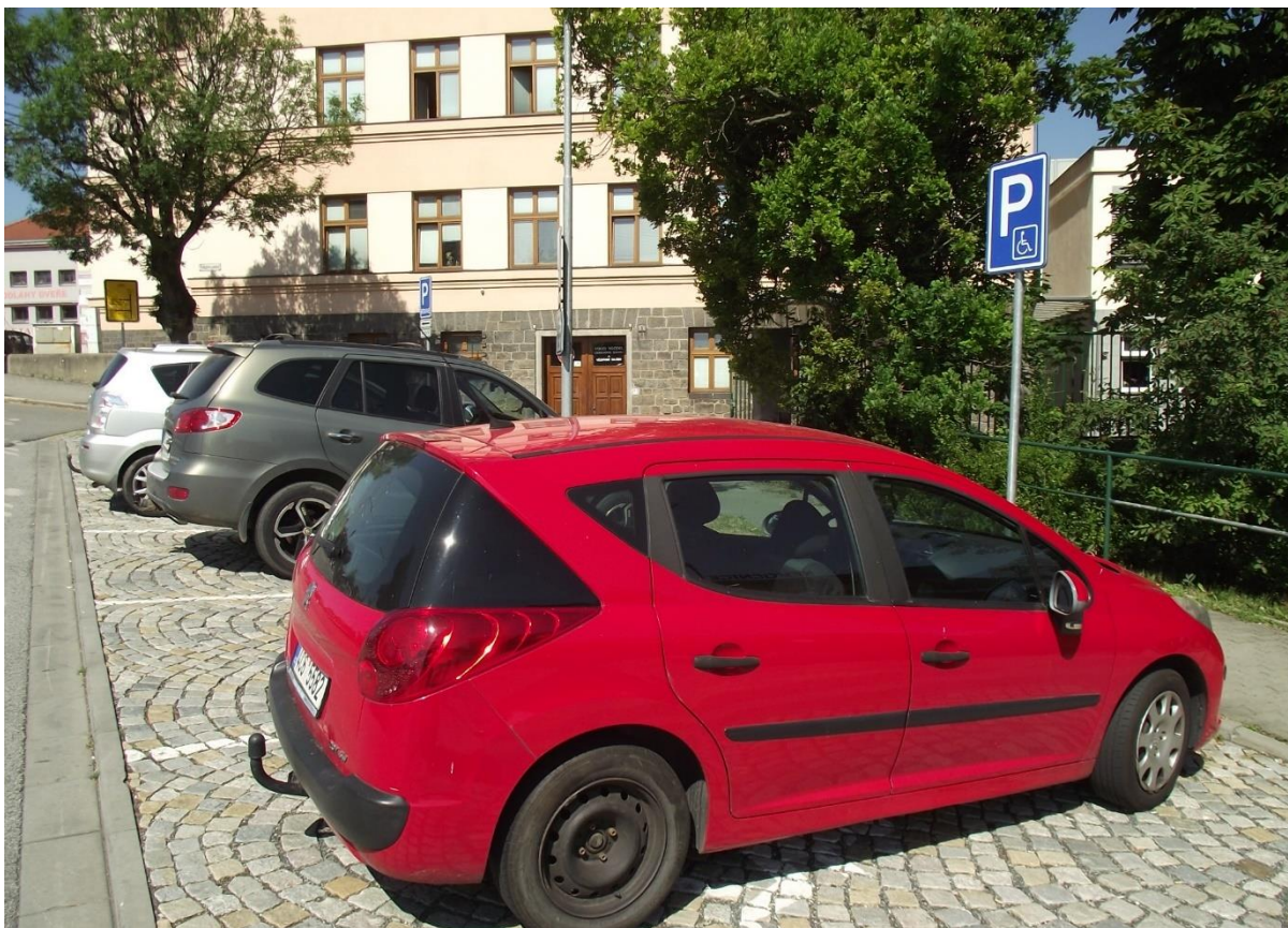
Vyhrazené parkovací stání – Purkyňovo nám.