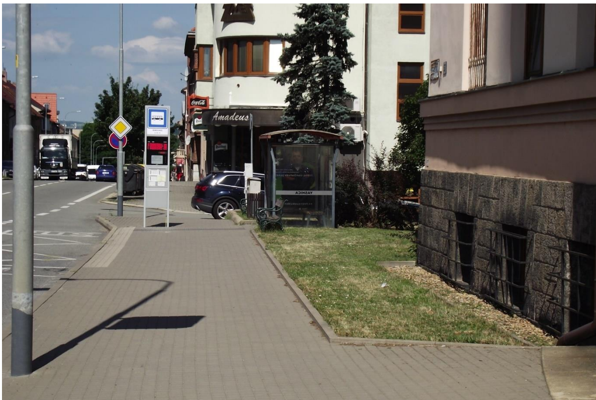
Zastávka MHD u budovy soudu na ul. Bráfova s názvem Nemocnice